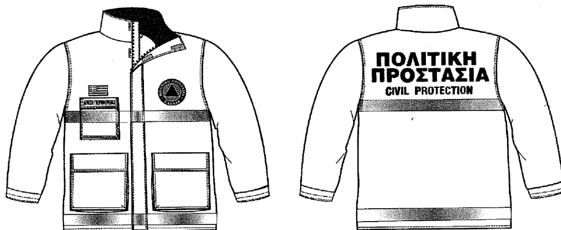
Εικόνα 1. Επιχειρησιακά μπουφάν Πολιτικής Προστασίας

Σύμφωνα με το 4678/22-11-2004 έγγραφο ΓΓΠΠ, τα επιχειρησιακά μπουφάν Πολιτικής Προστασίας θα πρέπει να έχουν την ακόλουθη μορφή: