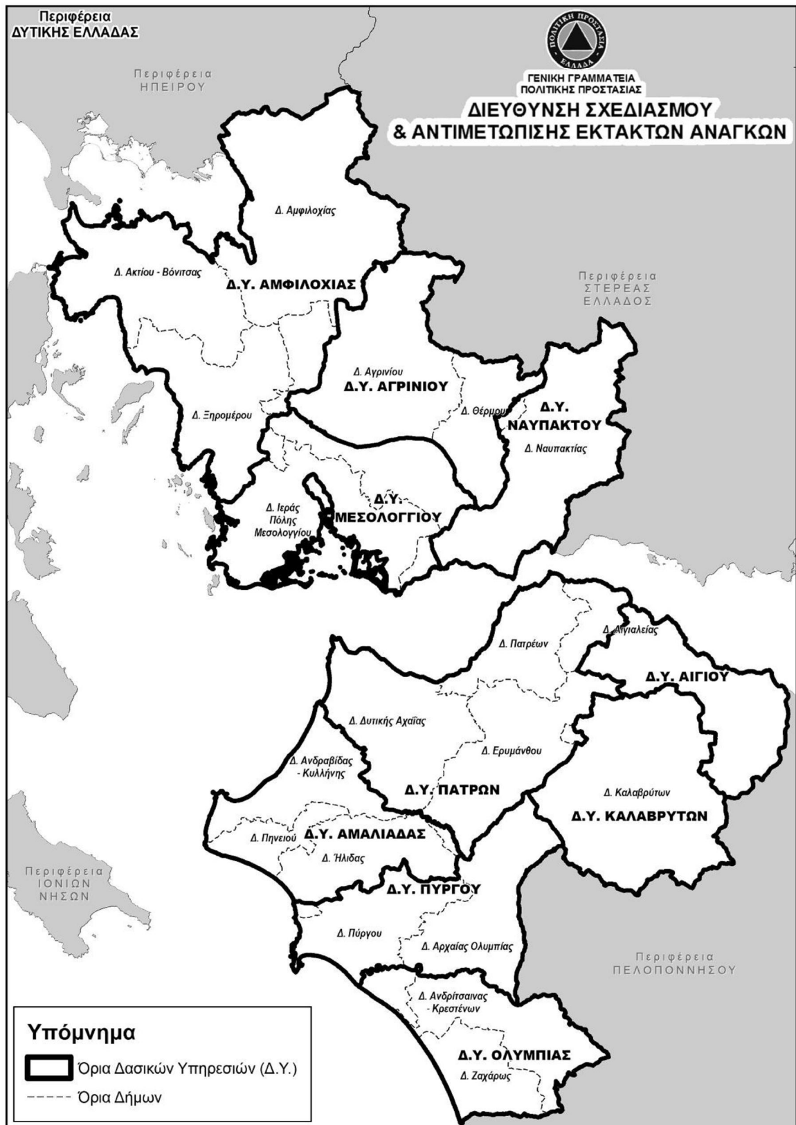
Πίνακας 1: Χαρτογραφική αποτύπωση τα διοικητικά όρια του Δήμου Αμφιλοχίας.