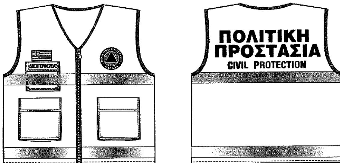
Εικόνα 2. Επιχειρησιακά γιλέκα Πολιτικής Προστασίας

Αναλυτικές προδιαγραφές για την εμφάνιση των επιχειρησιακών μπουφάν και γιλέκων Πολιτικής Προστασίας δίνονται στο 4678/22-11-2004 έγγραφο ΓΓΠΠ.